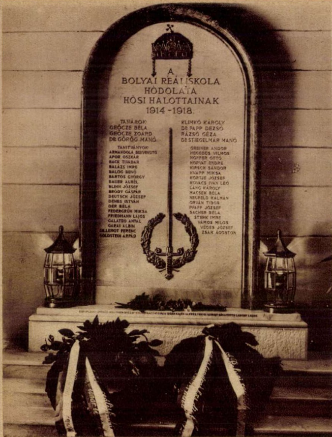
Hősi halottak emléktáblája a Bolyai reáliskola falán.