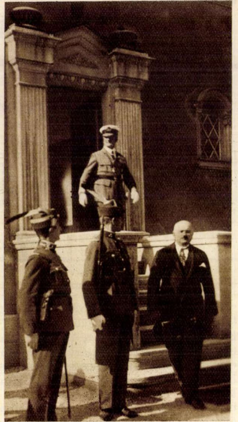
Horthy Miklós kormányzó Tatabányán megtekintette a szénbányát.