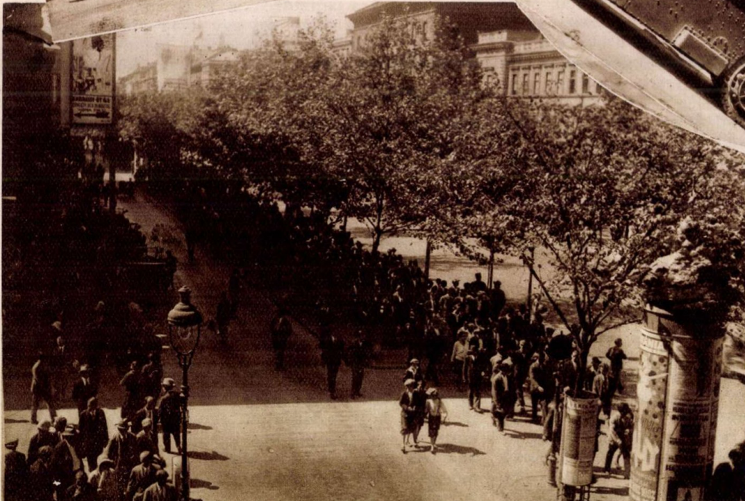
Képek a véres szeptember 1-ről. Fönt, balra: Rendőrök az Andrássy-úton. Alatta: A tüntetők az Andrássy-úton. Jobbra: Páncélauto a Városligetben.