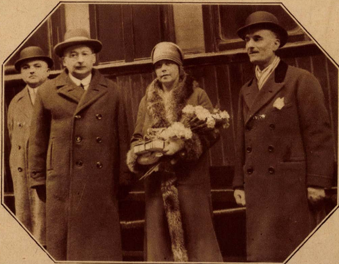
Gróf Klebelsberg Kunó kultuszminiszter felesége társaságában Rómába utazott, ahol a magyar-olasz együttműködés kimélyítésén dolgozik. Képünk a kultuszminisztert felesége és Durini di Monza gróf budapesti olasz követ társaságában ábrázolja a Déli-vasút pályaudvarán