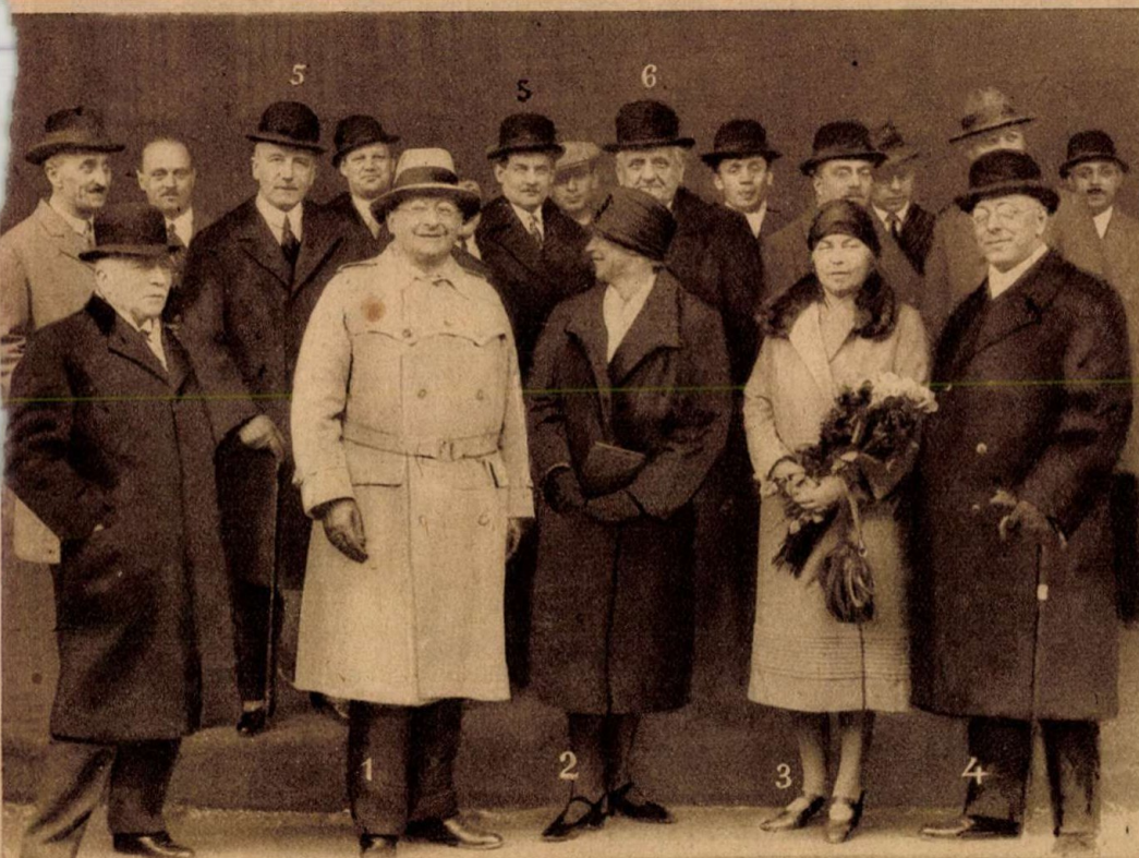
Gróf Klebelsberg Kunó kultuszminiszter szombaton Berlínbe utazott a berlini Collegium Hungaricum meglátogatására és a német egyetemi intézmények tanulmányozására; képzünk: a kultuszminiszter fogadtatása a berlini pályaudvaron; 1. gróf Klebelsberg Kunó, 2. Becker porosz kultuszminiszter felesége, 3. gróf Klebelsberg Kunóné, 4. Becker porosz kultuszminiszter, akit a budapesti, szegedi és debreceni egyetem a magyar-német kulturális kapcsolatok ápolásáért tiszteletbeli doktorrá választott. Mögöttük: 5. báró Schön budapesti német követ, 6. Kánya Kálmán berlini magyar követ.