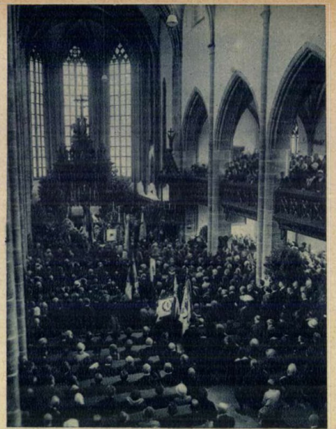
Wagner Siegfried temetése. Érdeklődők a dóm körül, jobbra a ravatal a dómban.