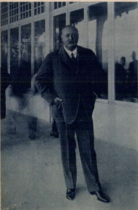
Fessal, iraki király, Hindenburgtól távozik.