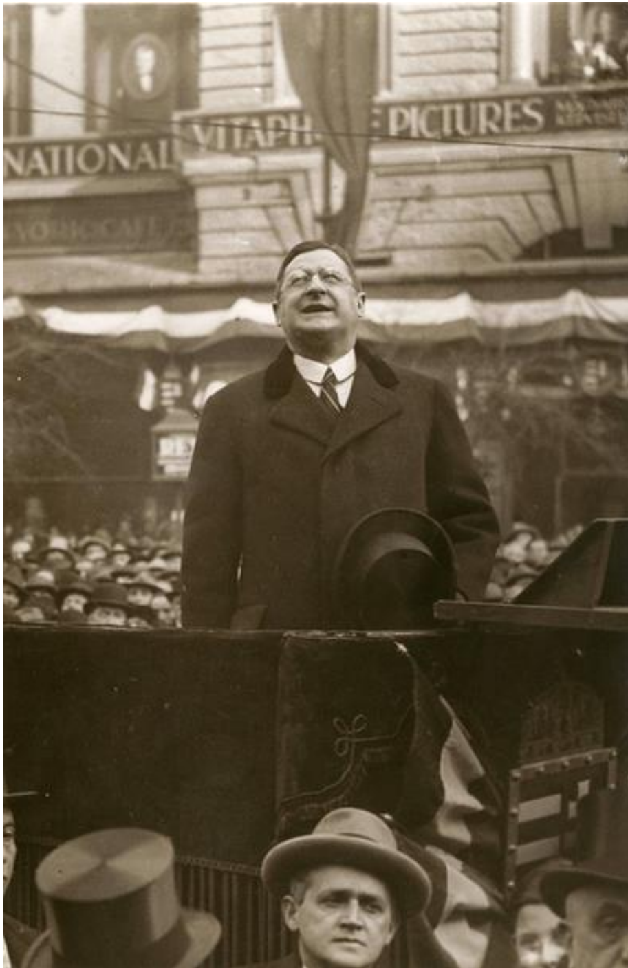
gróf Klebelsberg Kuno miniszter egy gyűlésen. | Europeana