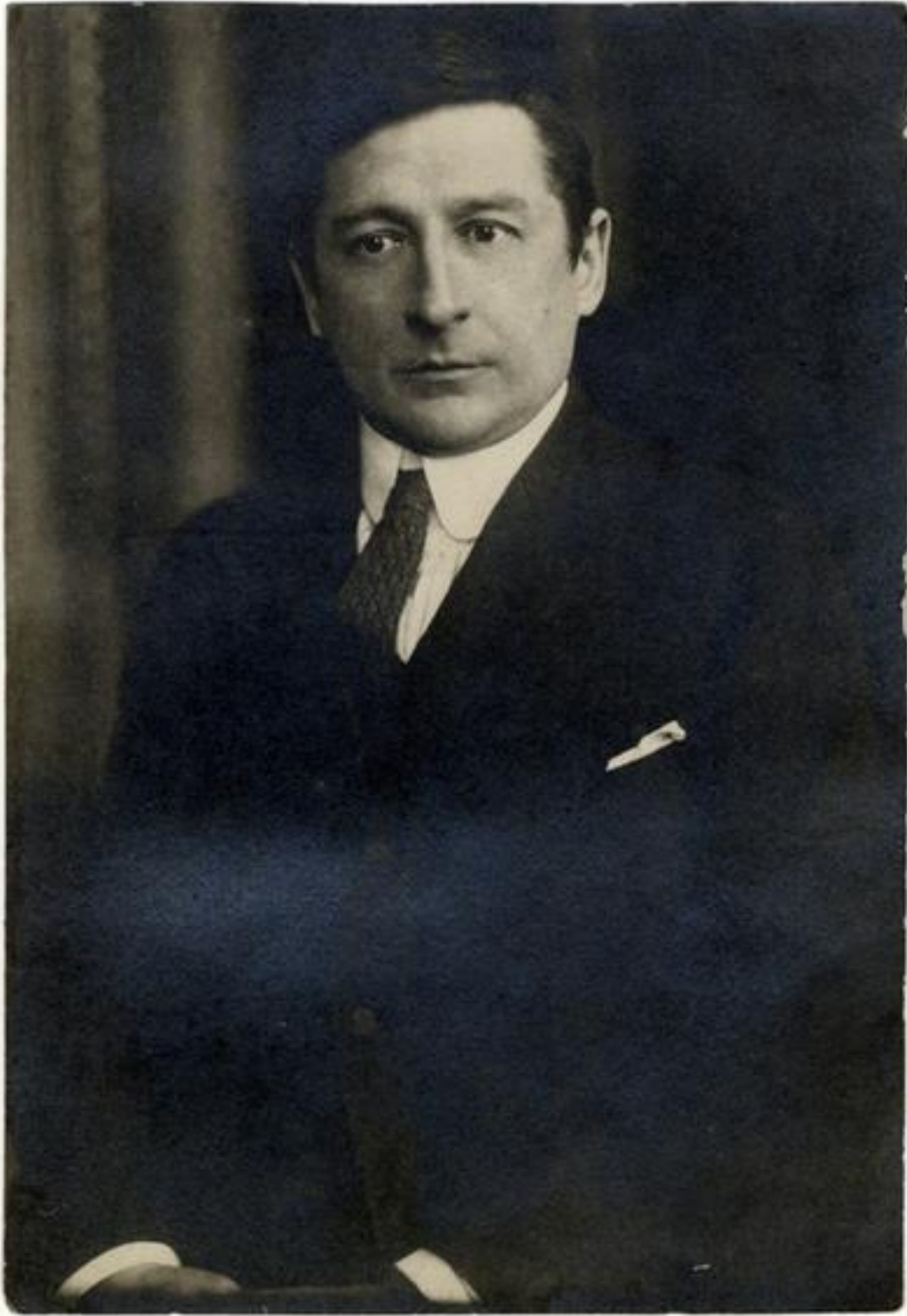
Klebelsberg Kunó, derékkép