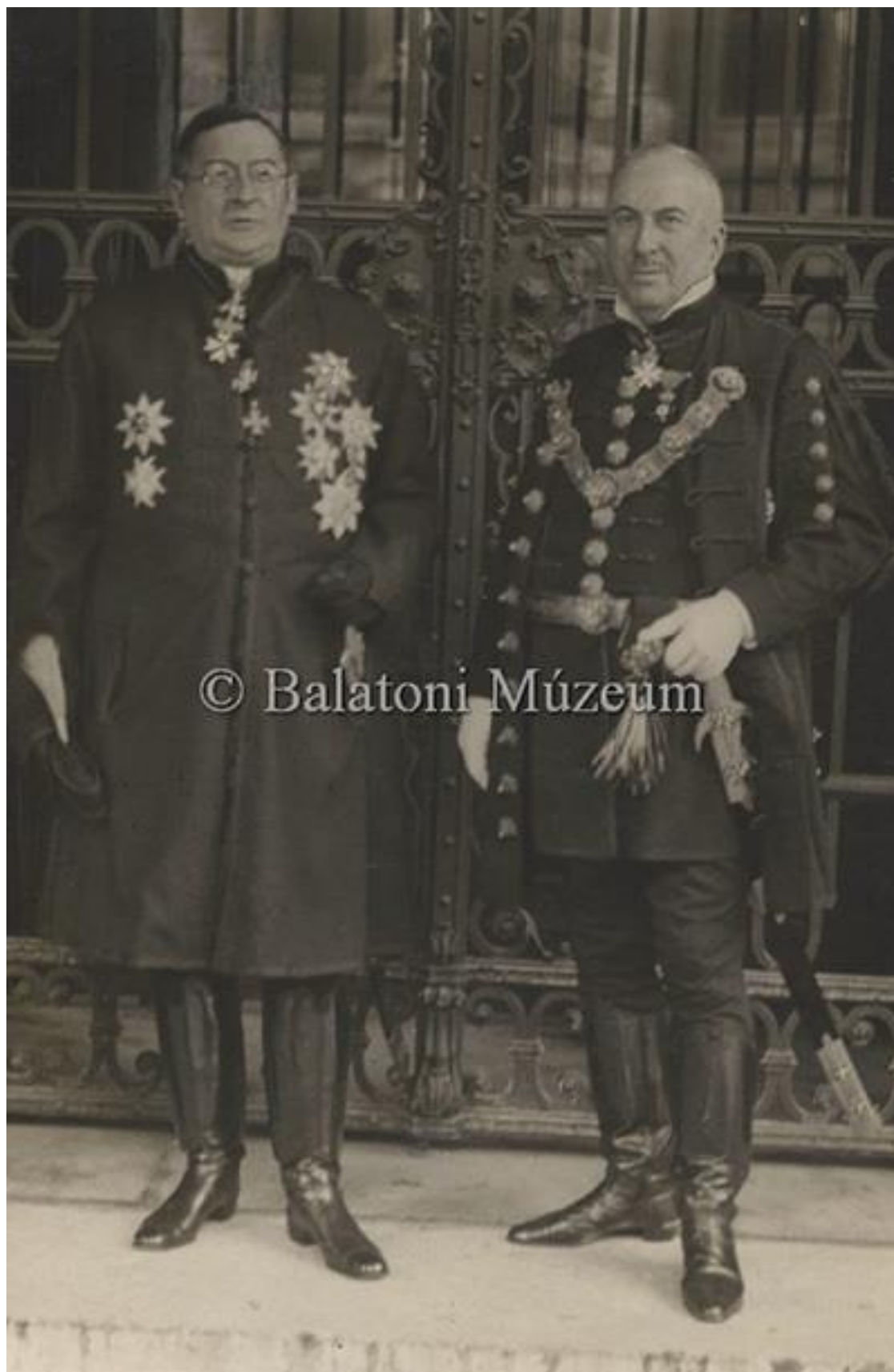
Gróf Klebelsberg Kuno magyar jogász | Europeana