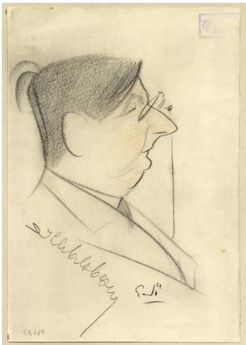
Kleblsberg Kunó