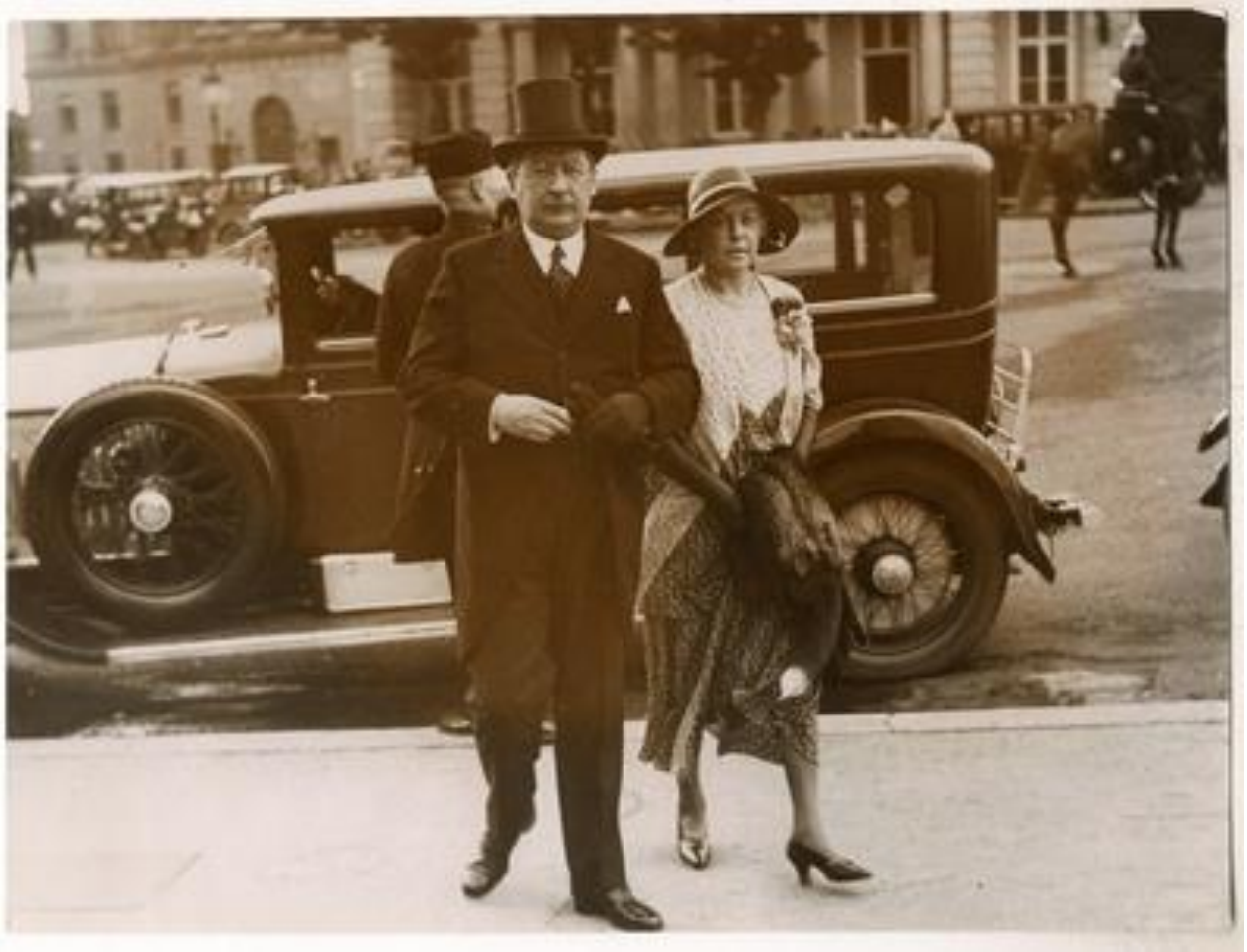
Klebelsberg Kunó és felesége megérkezik a kormányzó garden-partyjára.