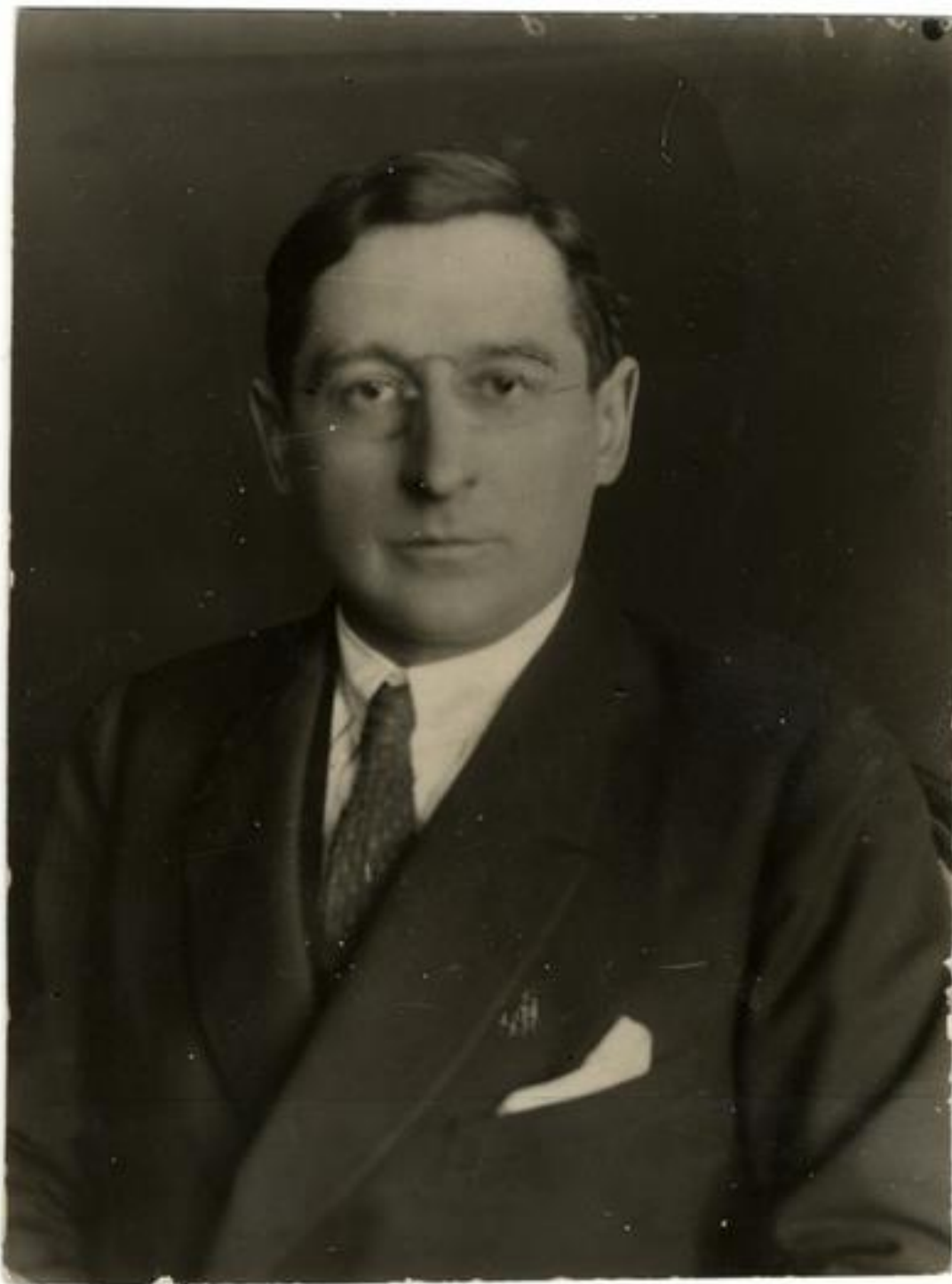
gróf Klebelsberg Kuno miniszter