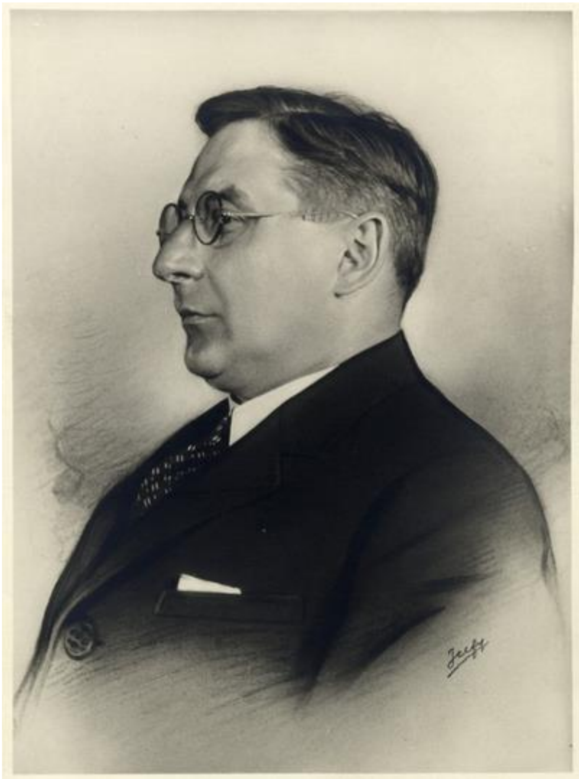
gróf Klebelsberg Kunó miniszter