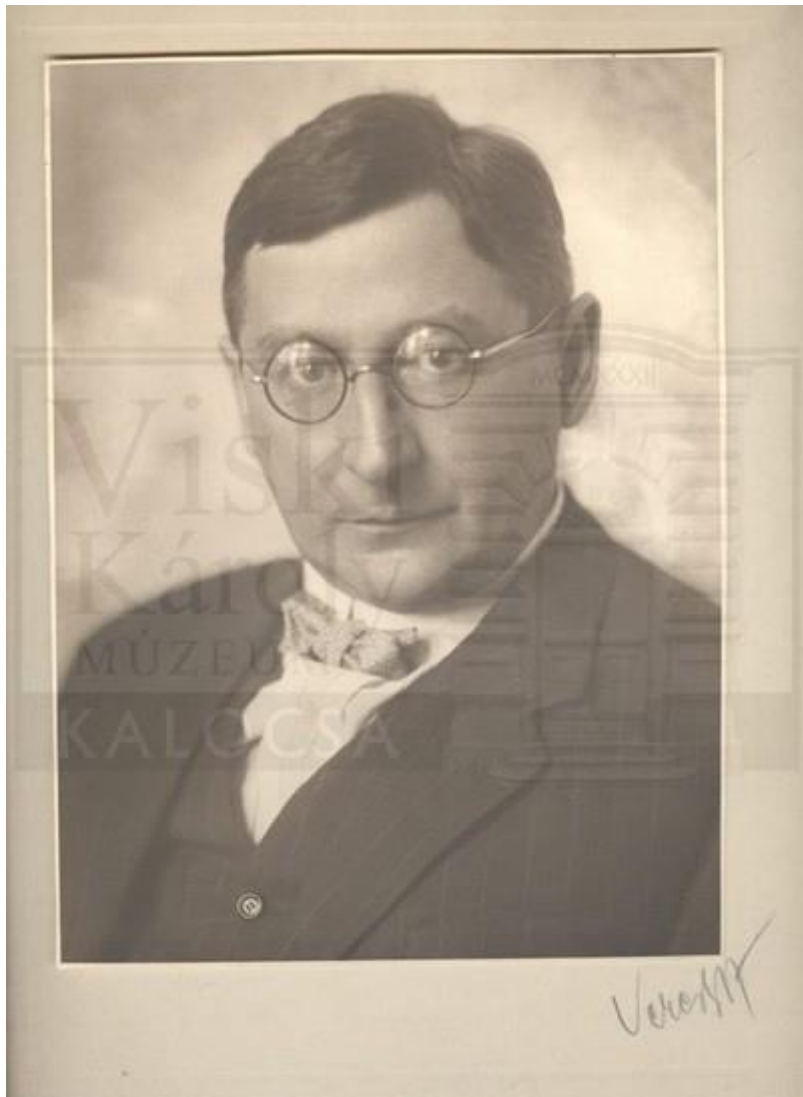
Fénykép | Europeana