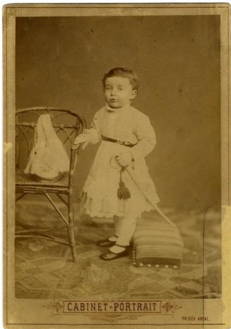
Klebelsberg Kuno gróf miniszter gyerekként