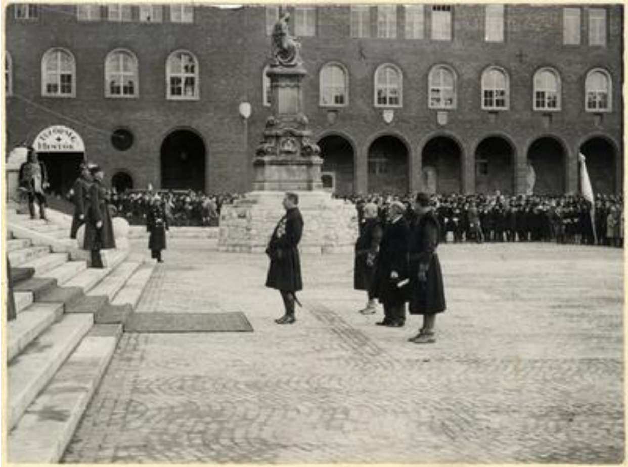
gr. Klebelsberg Kunó a szegedi Pantheon megnyitó ünnepségen | Europeana