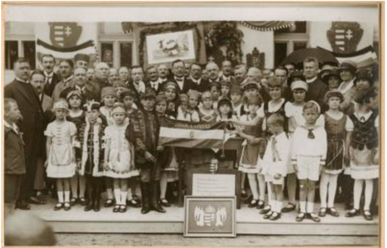
Elemi iskolák felavatása Kispesztben Klebelsberg Kunó által | Europeana