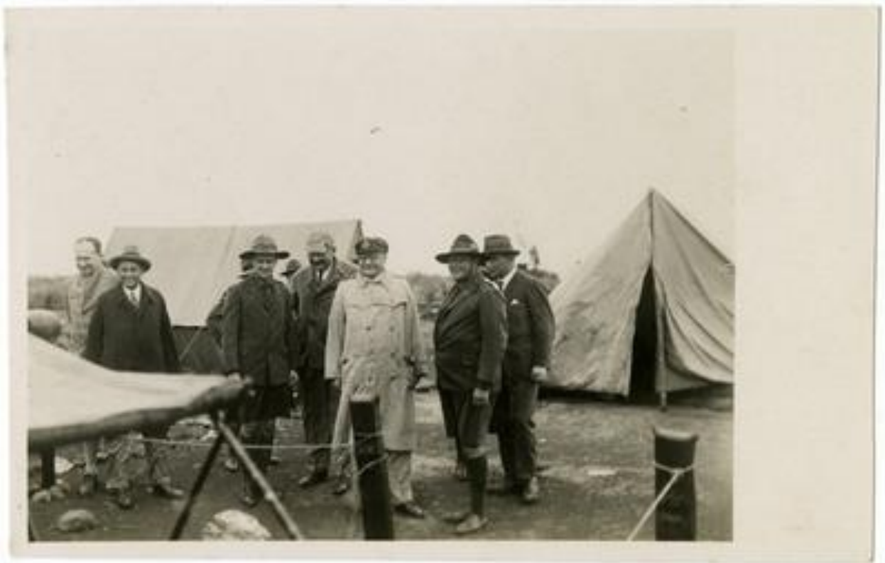
gróf Klebelsberg Kunó egy cserkész táborban.