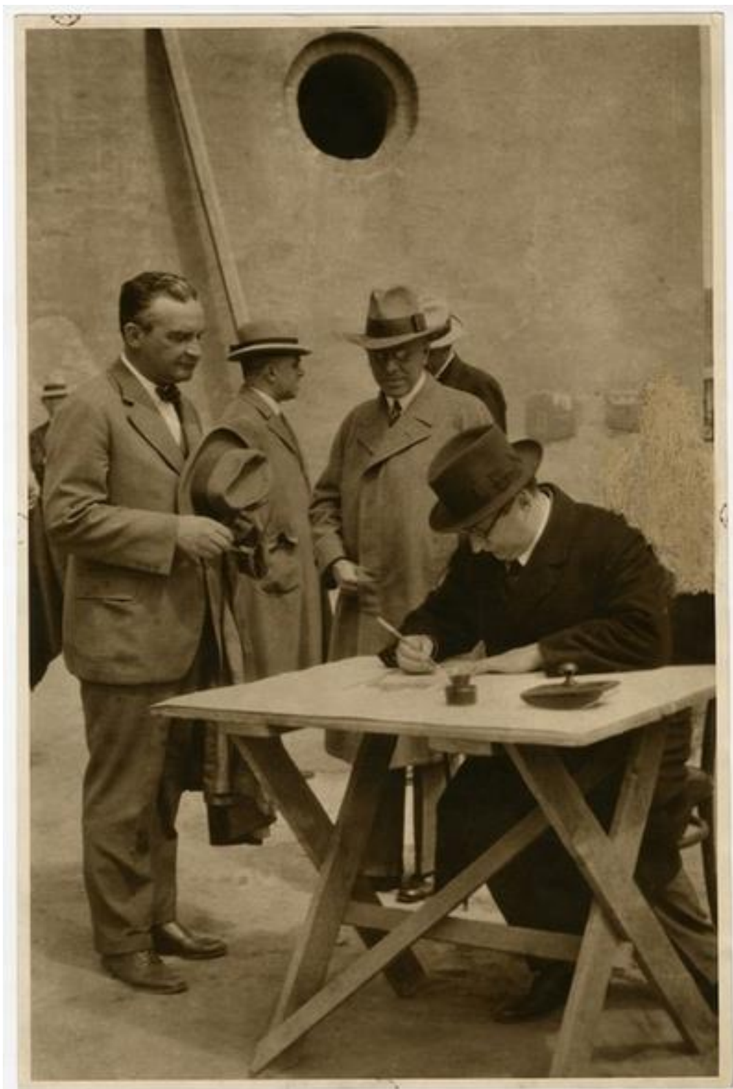
Klebelsberg Kunó aláírja az egyetem alapító levelét.