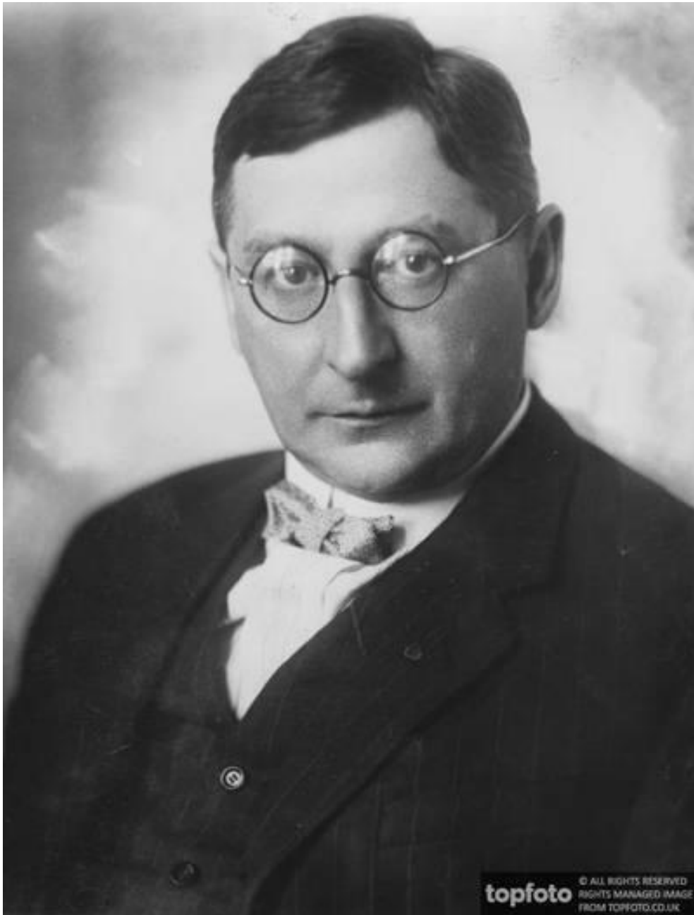
Count Kuno Klebelsberg . x000D Hungary | Europeana