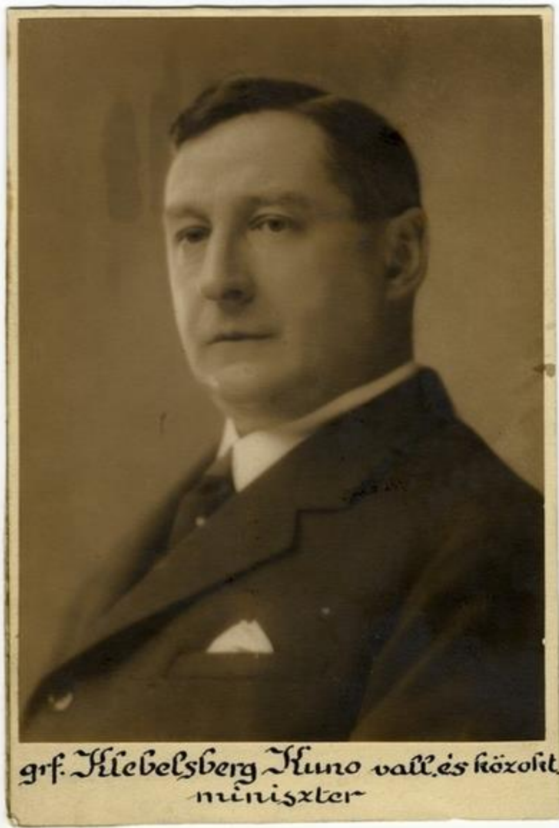
grf. Klebelsberg Kuno vall. és közokt. miniszter