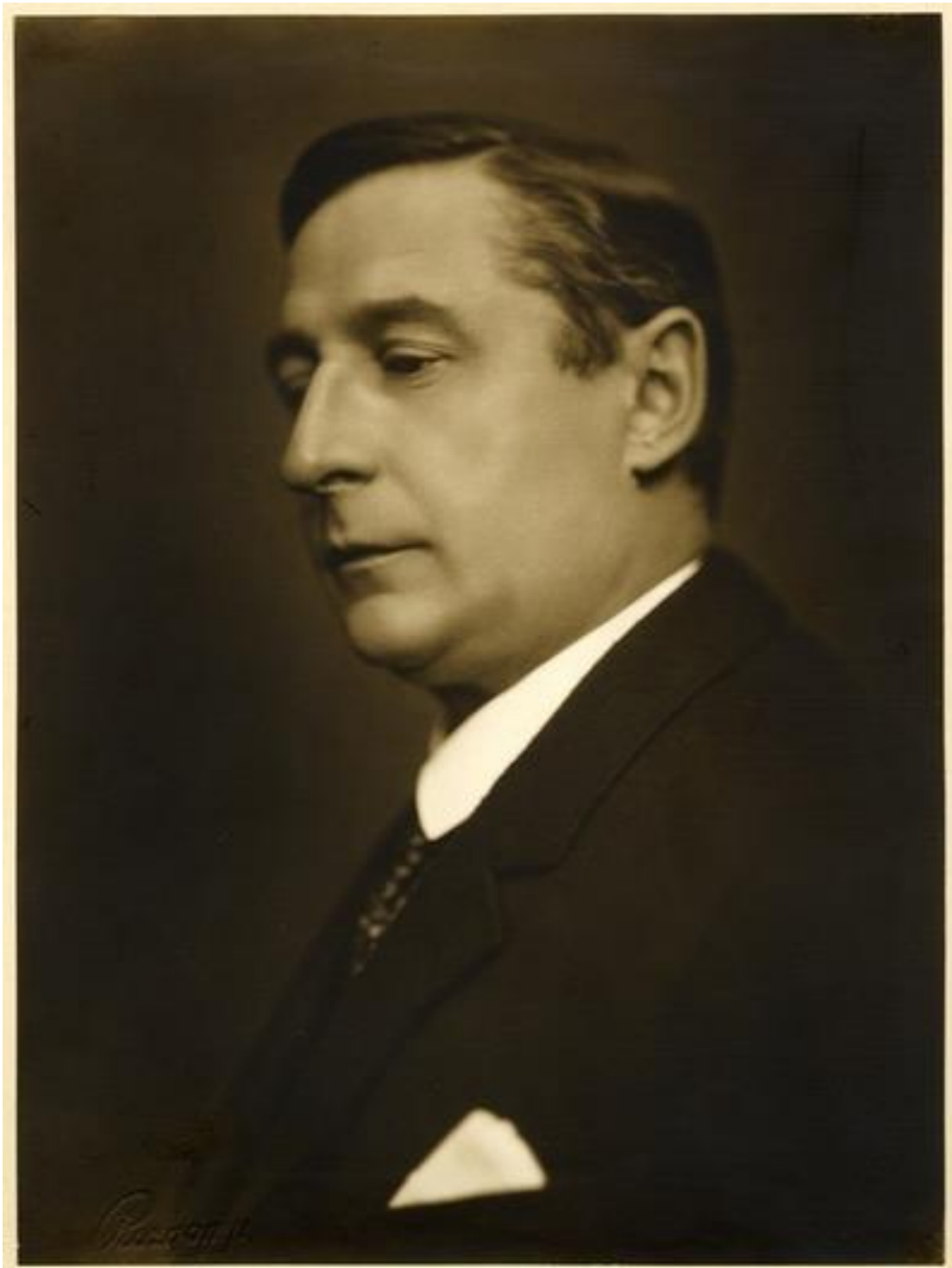
Klebelsberg Kunó. | Europeana