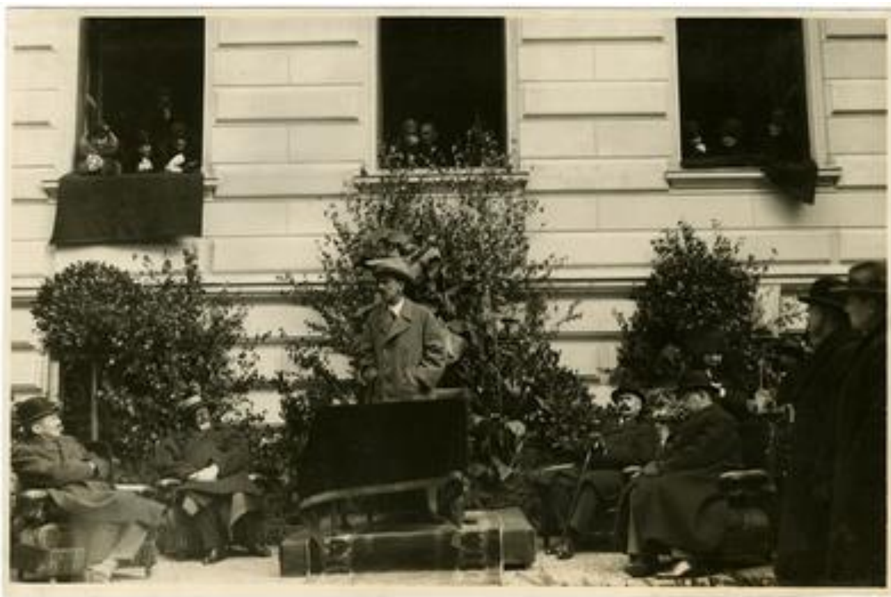
Bethlen István és Klebelsberg Kunó a soproni Hűségkapu felavatásán.