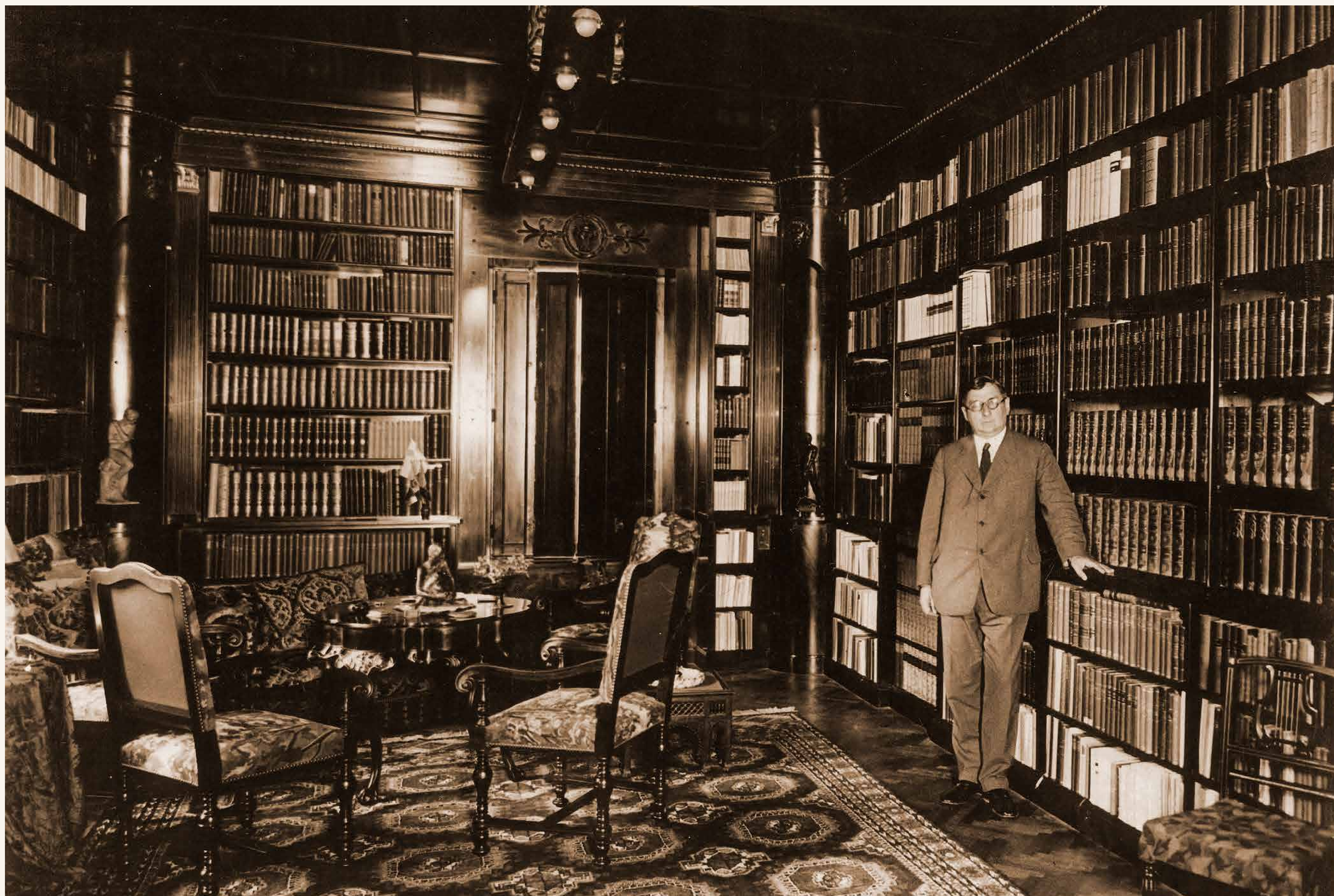
Klebelsberg Kuno a hidegkúti villa könyvtárszobájában (1932)