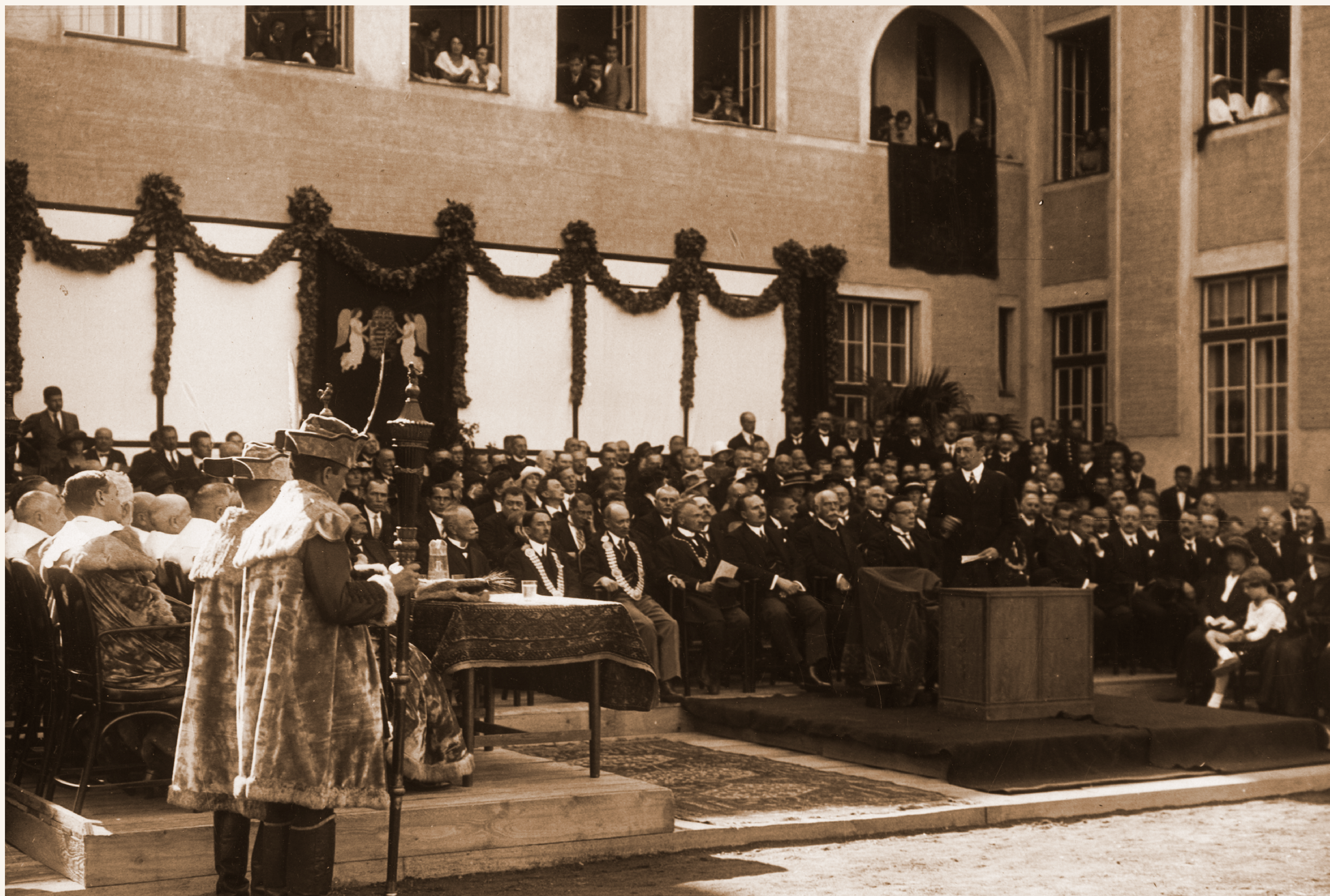
A Belgyógyászati, Sebészeti, Röntgen Klinikák megnyitása Debrecenben (1923. szeptember 23.)