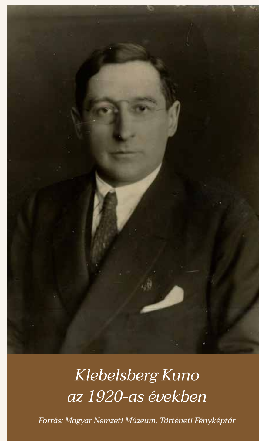
Klebelsberg Kuno az 1920-as években

Hasonlóan kiemelt figyelmet szentelt a felsőoktatás támogatására. Első helyen állt az akkor már Tisza István nevét viselő debreceni tudományegyetem háború miatt megakadt fejlesztésének folytatása. 1923-ban ünnepélyesen felavatták a nagyerdei klinikai telepet, s 1927-ben megkezdődhetett a központi épület nagyszabású terveinek kivitelezése, ami 1932-re fejeződött be. Szintén az ő nevéhez fűződik az elcsatolt felsőoktatási intézmények megmentése. A kolozsvári Ferenc József Tudományegyetem Szegedre, a pozsonyi Erzsébet Tudományegyetem Pécsre költözött át, a selmecháb-