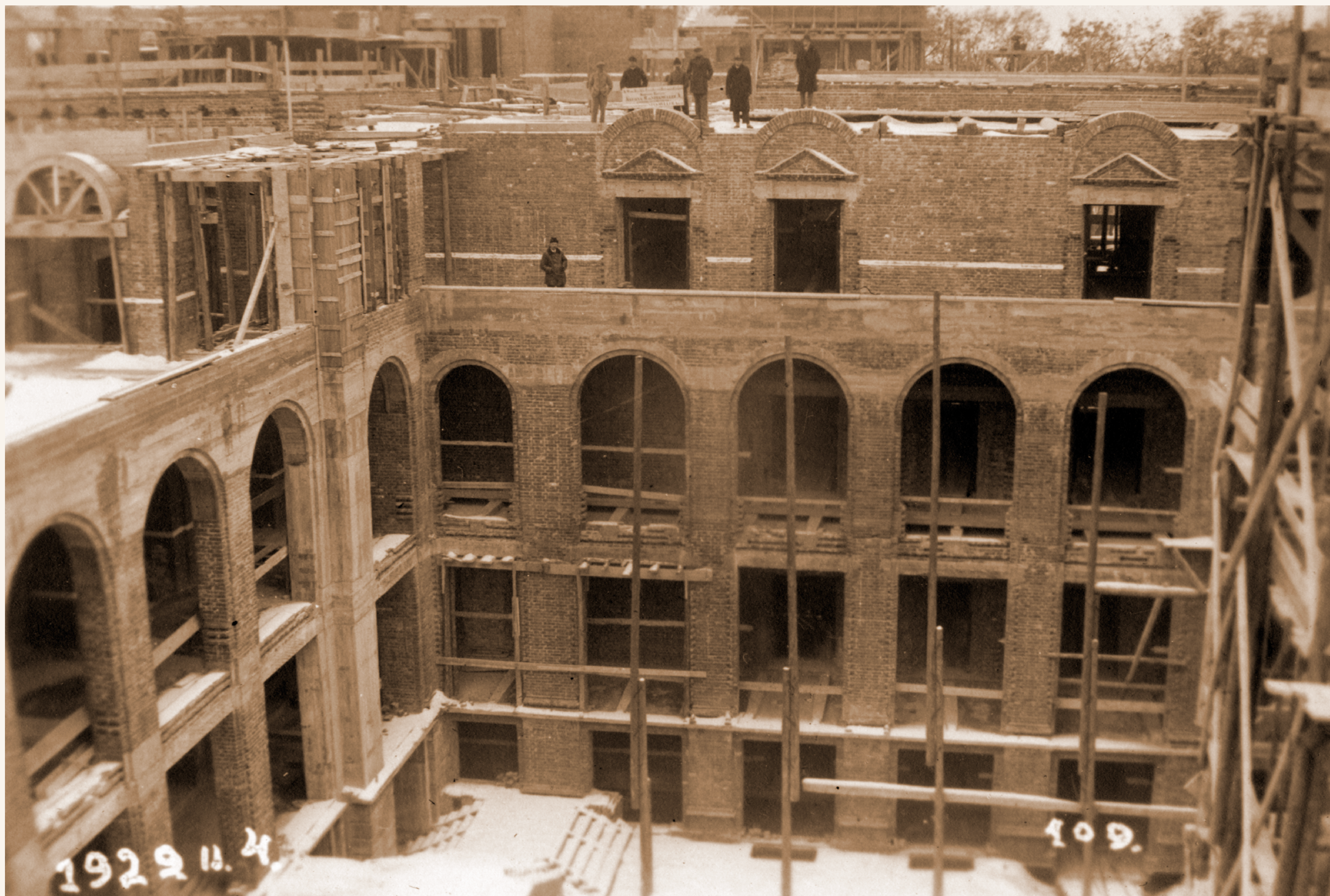
Az épülő Díszudvar és kerengő (1929. február 4.)