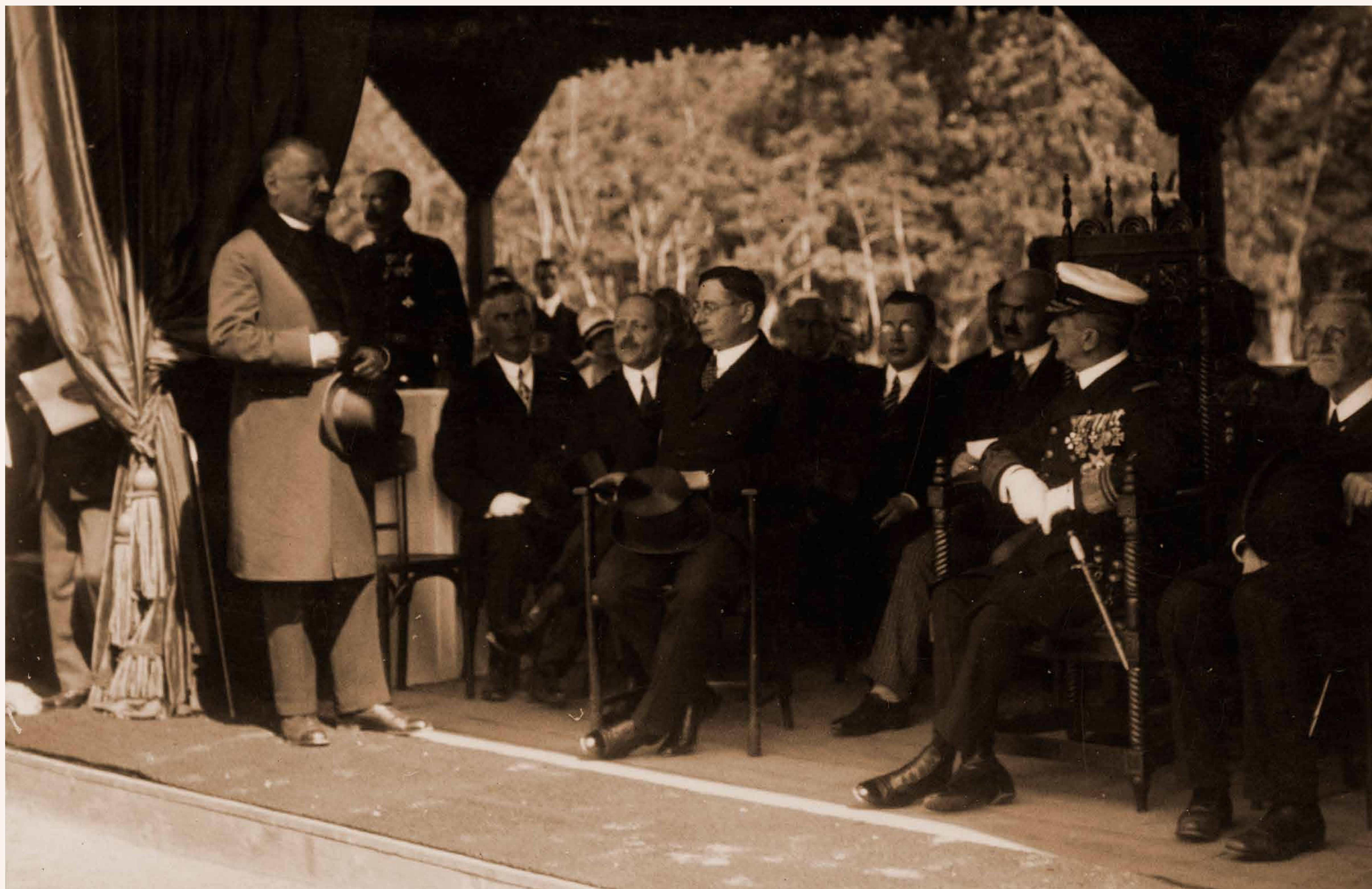
Az Egyetem Központi Főépületének alapkövetélteli ünnepsége alkalmából Baltazár Dezső református püspök üdvözli Klebelsberg Kunot és a kormányzót (1927. június 3.)