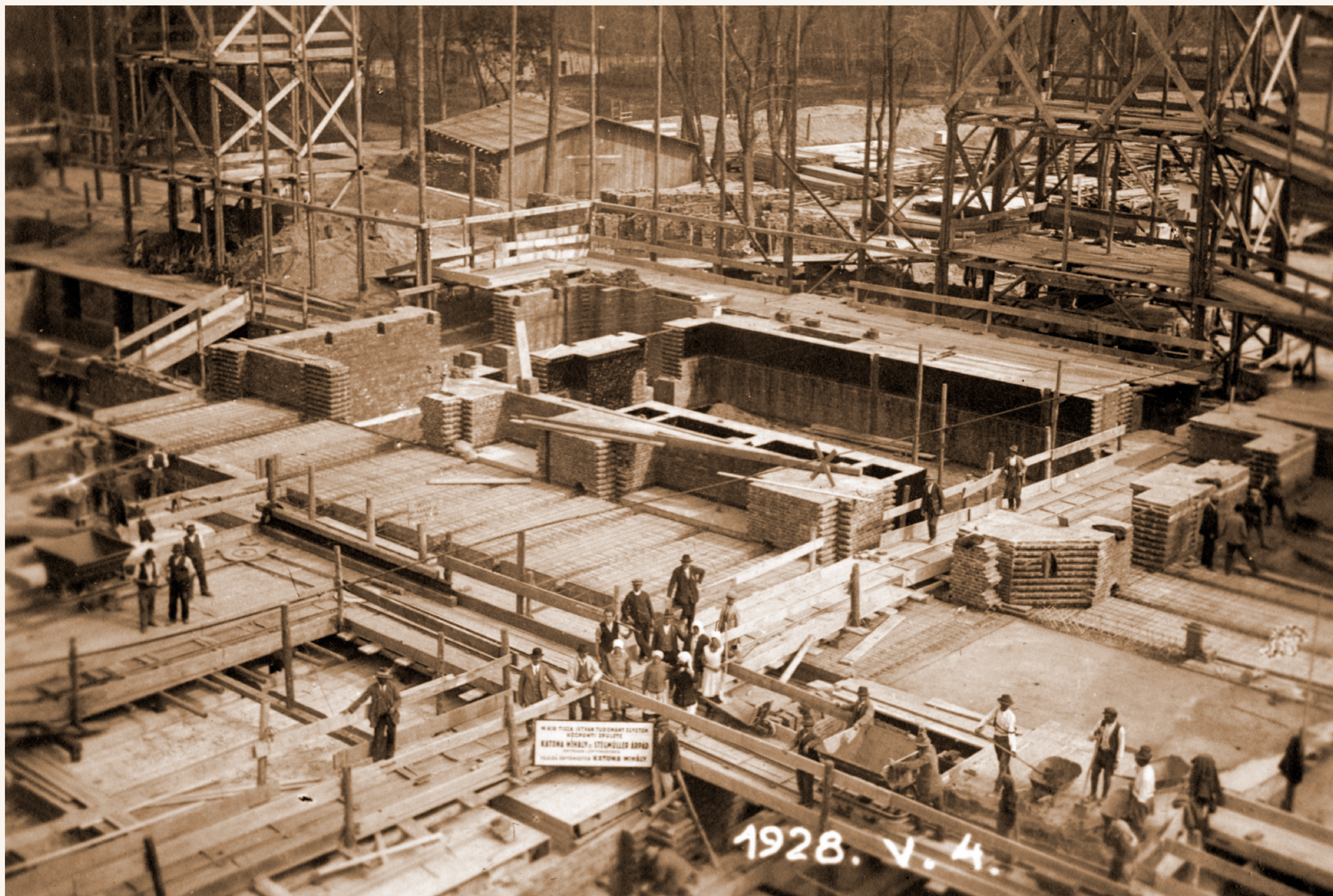
Az Egyetem Központi Főépületének építési munkálatai (1928. május 4.)