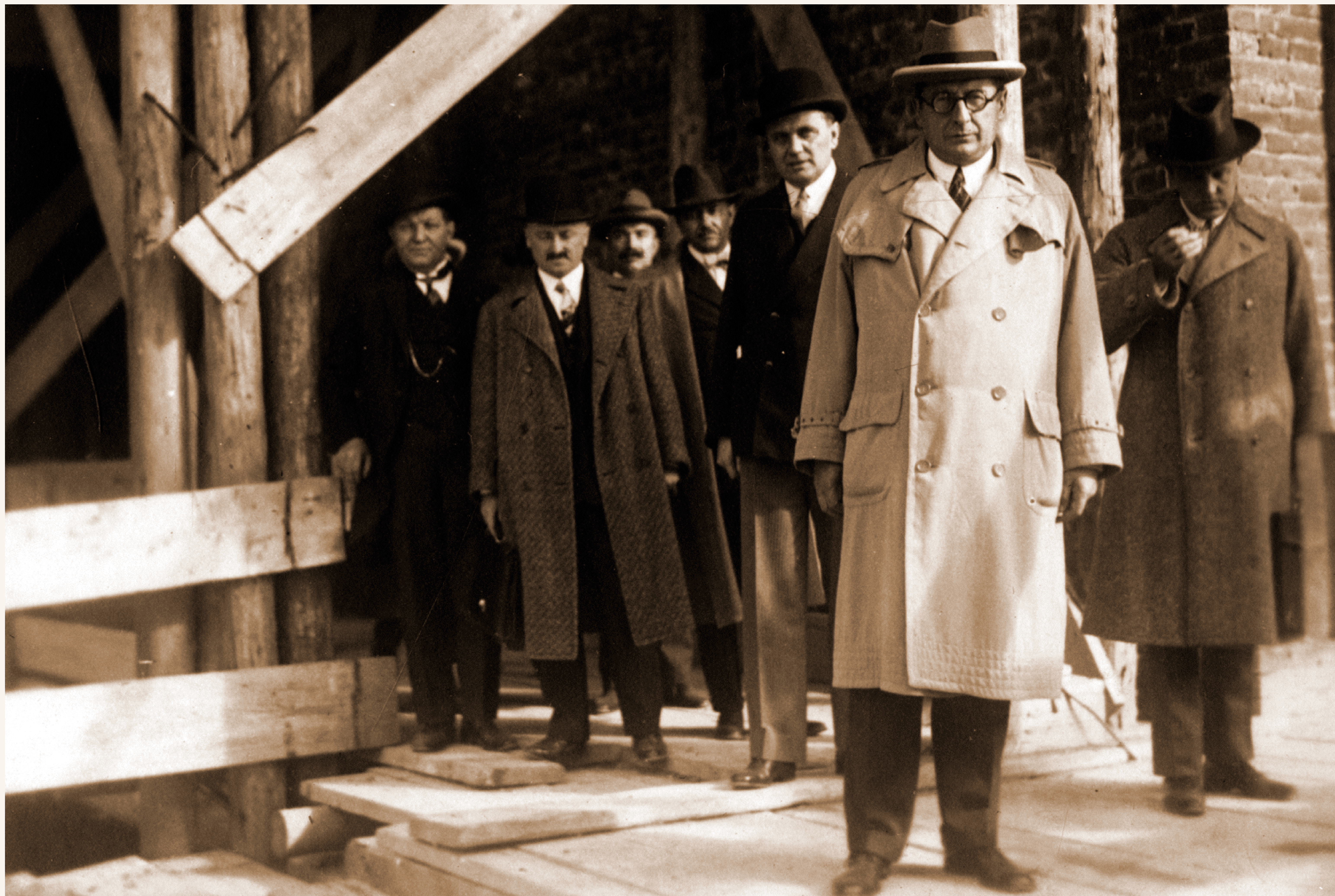
Klebelsberg meglátogatja az épülő egyetemet (1929)