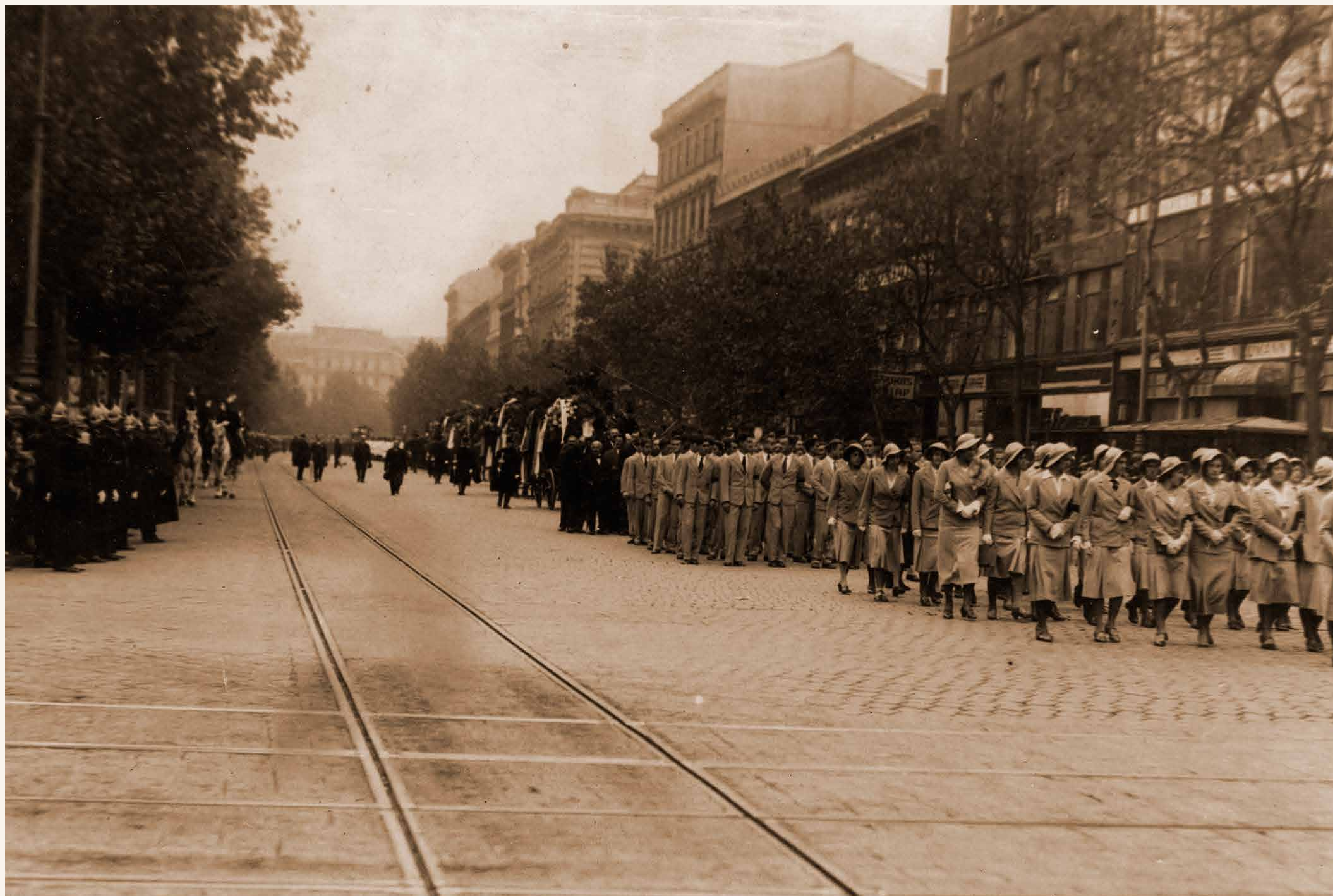
Klebelsberg Kunot utolsó útjára kísérő gyászmenet Budapesten (1932. október 14.)