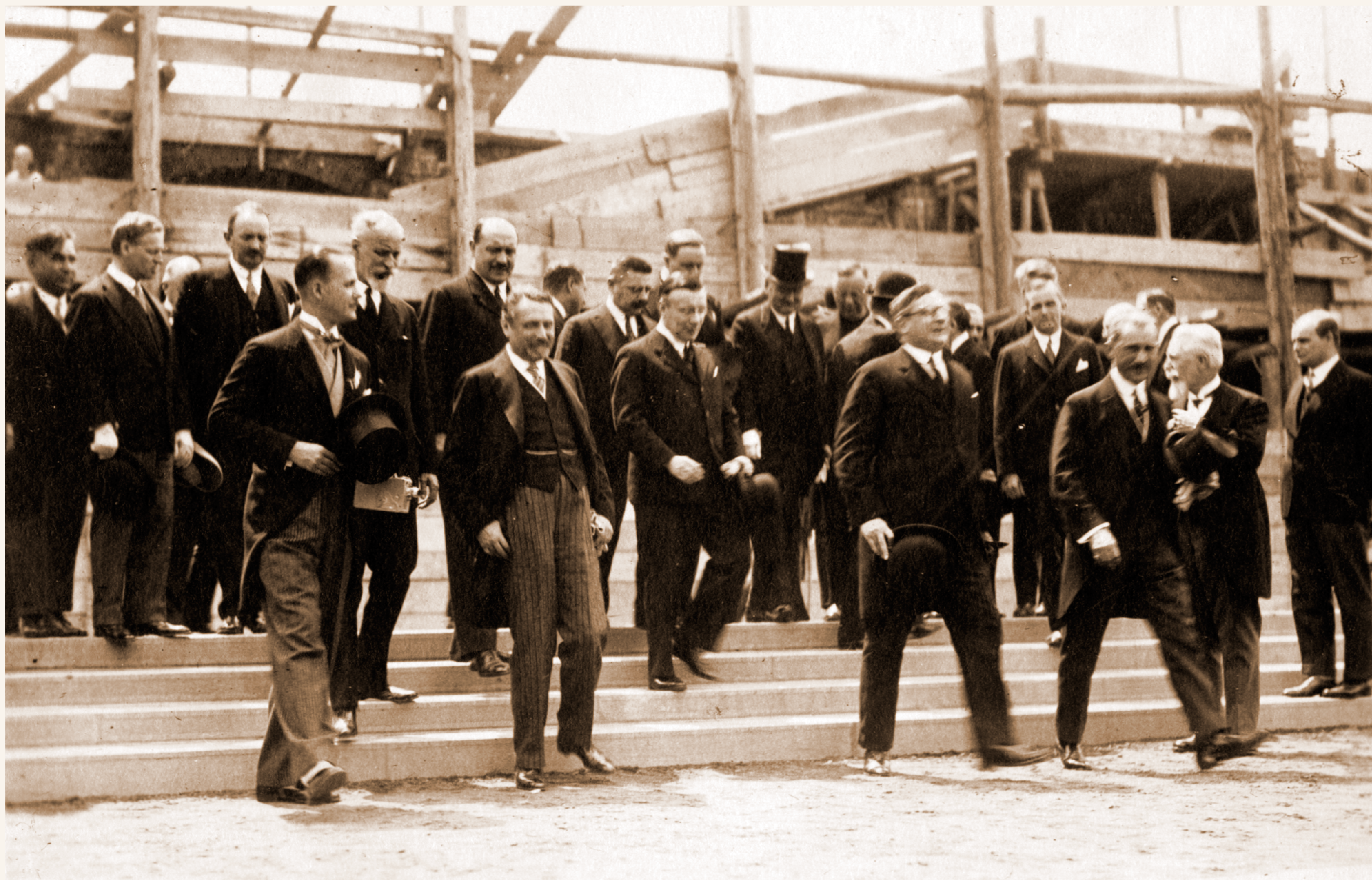
Klebelsberg Vásáry István polgármesterrel a debreceni Déri Múzeum avatására tart. Háttérben az épülő Posta épülete. (1930. május 25.)