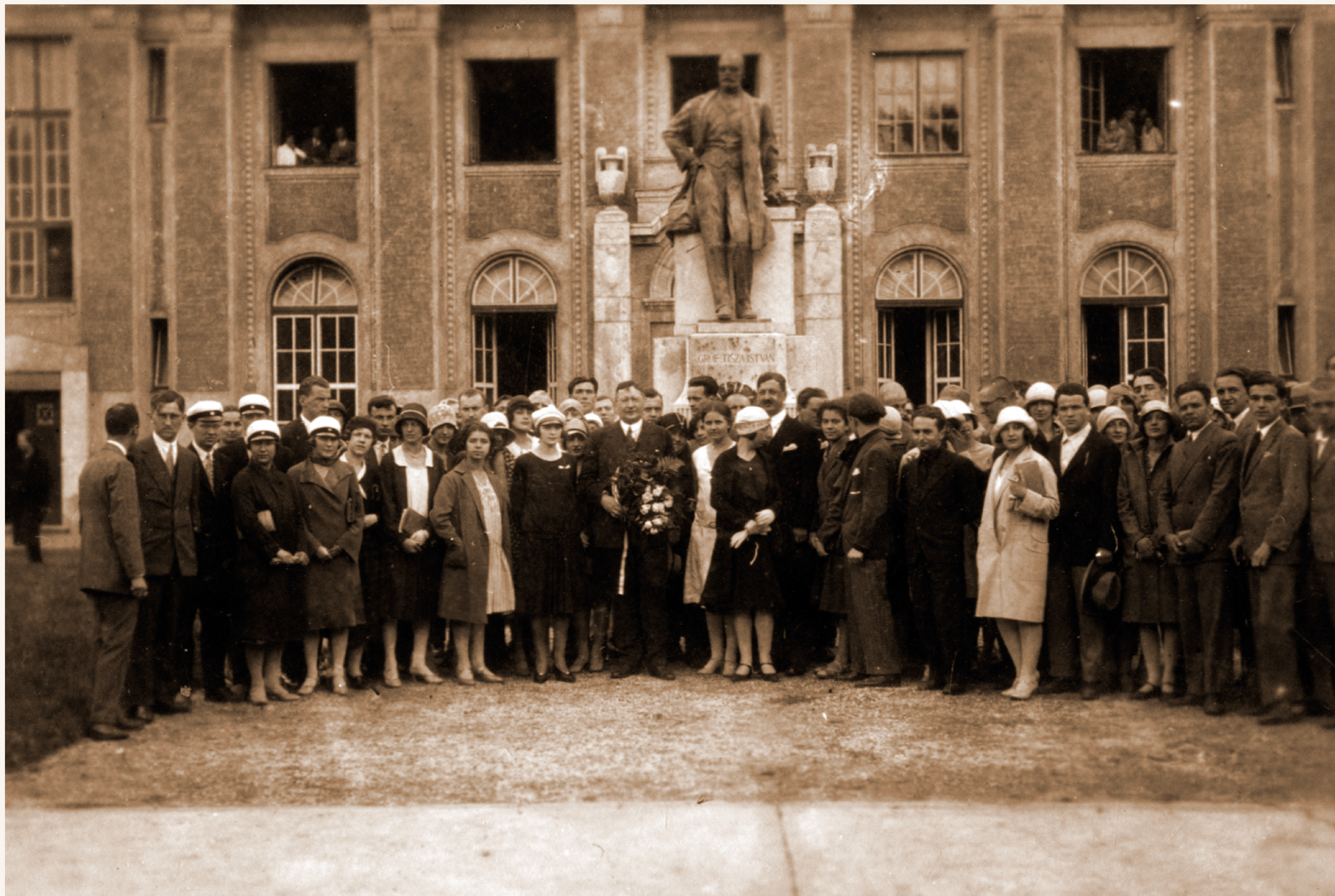
Klebelsberg a Debreceni Nyári Egyetem hallgatóival Tisza István szobra előtt (1929. július 15.)