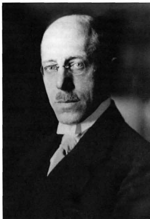
Carl Heinrich Becker (1876–1933), nemzetközi bírú orientalista, 1921-ben, majd 1925–30 között porosz kultuszminiszter, Gragger Róbert jó barátjaként a német–magyar tudományos kapcsolatok lelkes támogatója

Nem sokkal a teljes üzem 1927 őszi beindulása után azonban, Klebelsberg 1931-ben történt lemondása, valamint a gazdasági világválság és ezekből adódóan a külföldi magyar intézetek addigi támogatásának tetemes csökkentése miatt már komoly gondot okozott a Collegium Hungaricum épületének nagysága. A fenntartási költségek megtakarítása céljából 1932-ben 12 helyiséget bérbe adtak a porosz kormánynak, amelyekbe a berlini egyetem sémi és iszlám intézete költözött be. Mivel a Collegium gazdasági helyzete alig változott ezáltal, az ösztöndíjasok száma pedig egyharmadára csökkent, fölmerült az épület eladásának a lehetősége. Bár ehhez, pontosabban – mivel a berlini Collegium Hungaricum szűkebb keretek közötti fenntartását „okvetlenül fontosnak” tartották – a kisebb épületre való kicseréléshez mind a kultusz-, mind a külügyminiszter hozzájárult, 1934 nyarán Szily Kálmán kultusz-államtitkár ad acta tette az ügyet, mivel: „az újabb információk és a közvetlen úton, Berlinben szerzett tapasztalatom szerint a Collegium épületének eladása jelenleg sem politikai, sem kultúrpolitikai, sem anyagi szempontból nem volna előnyös.” Hasonló tervek többször szóba se kerültek.