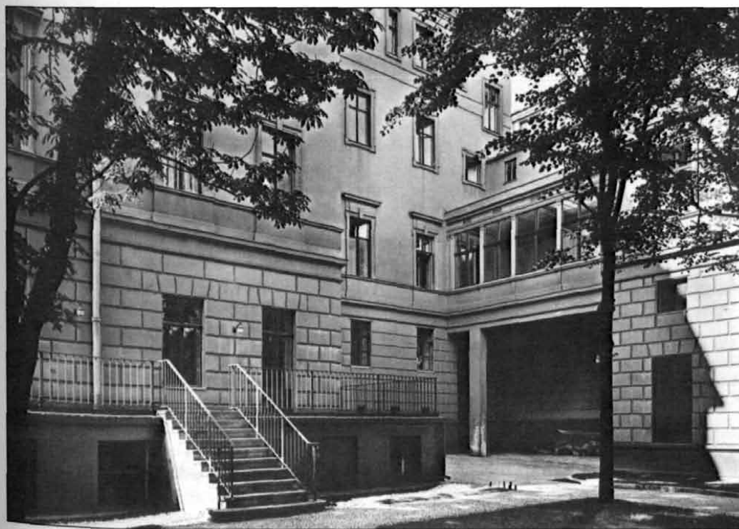
A Collegium Hungaricum kertje (Berlini Humboldt Egyetem, Hungarológiai Tanszék)