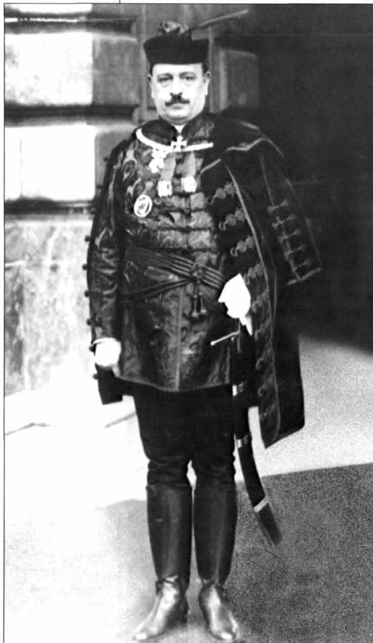
Hóman Bálint (1885–1951), a kiváló mediavista, magyar vallás- és közoktatásügyi miniszter (1932–1938 és 1939–1942), a „magyar–német sorközösség” meggyőződéses hirdetője (Magyar Nemzeti Múzeum)

és csupa arany épületet, amelyben harminc vagy talán negyven szegény diák van elhelyezve”, akik „kénytelenek a ragyogó termekben a templom egerei módjára élni.” Móricz egy „berlini magyarral” mondhatja ki: „Ez a Collegium Hungaricum teljesen eltévesztett dolog. Először is nemzetközi relációban igen hamis színben tünteti fel a magyarság erőviszonyát. Sem a franciáknak, sem az angoloknak, sem Amerikának ilyen fényes egyetemi képviselője nincs, úgyhogy egészen ferde dolog, mikor a szétdarabolt s megcsonkított és elszegényített Magyarországról beszélünk a berliniek vagy idegenek előtt. De a nagyobb baj az, hogy nem érhetünk el vele semmi célt. Ha az állam – mondja – fiúkat akar nevelni a jövőre, adjon nekik háromszáz márkát, vagy ha bőkezű akar lenni, négyszáz márkát havonta s küldje ki, hogy éljenek a maguk lábán... Ha az épület vásárlási, renoválási s fenntartási költségeit tőkésítjük, minden diák ezer márkába kerül havonta.” Domanovszky Sándor az Országos Ösztöndíjtanács ügyvezető igazgatójaként cáfolta Móricz Zsigmond állításait. Kijelentette: „az állam alkalmi vételként” szerezte meg az épületet. Az ösztöndíjasok tanulmányi kiadásait a Collegium téríti, „nekik ingyen színházi és hangversenyjegyeket is szerez ... Gazdag ország nem szorul úgy rá az ösztöndíjakra, mint a megnyomított Magyarország, ... ezek az országok másfelé orientálódnak ösztöndíjasaikkal.” Egyben adatokkal bizonyította, mennyire téves az az állítás, hogy egy-egy ösztöndíjas havonta 1000 márkába kerülne.