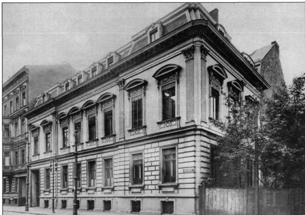
A Collegium Hungaricum épülete (a Herz-palota, Dorotheenstrasse 2.) az átépítés előtt, 1925 körül (Magyar Művészet, 1929. 7. szám)

Gragger halála után Tamedly Mihály, a bé-