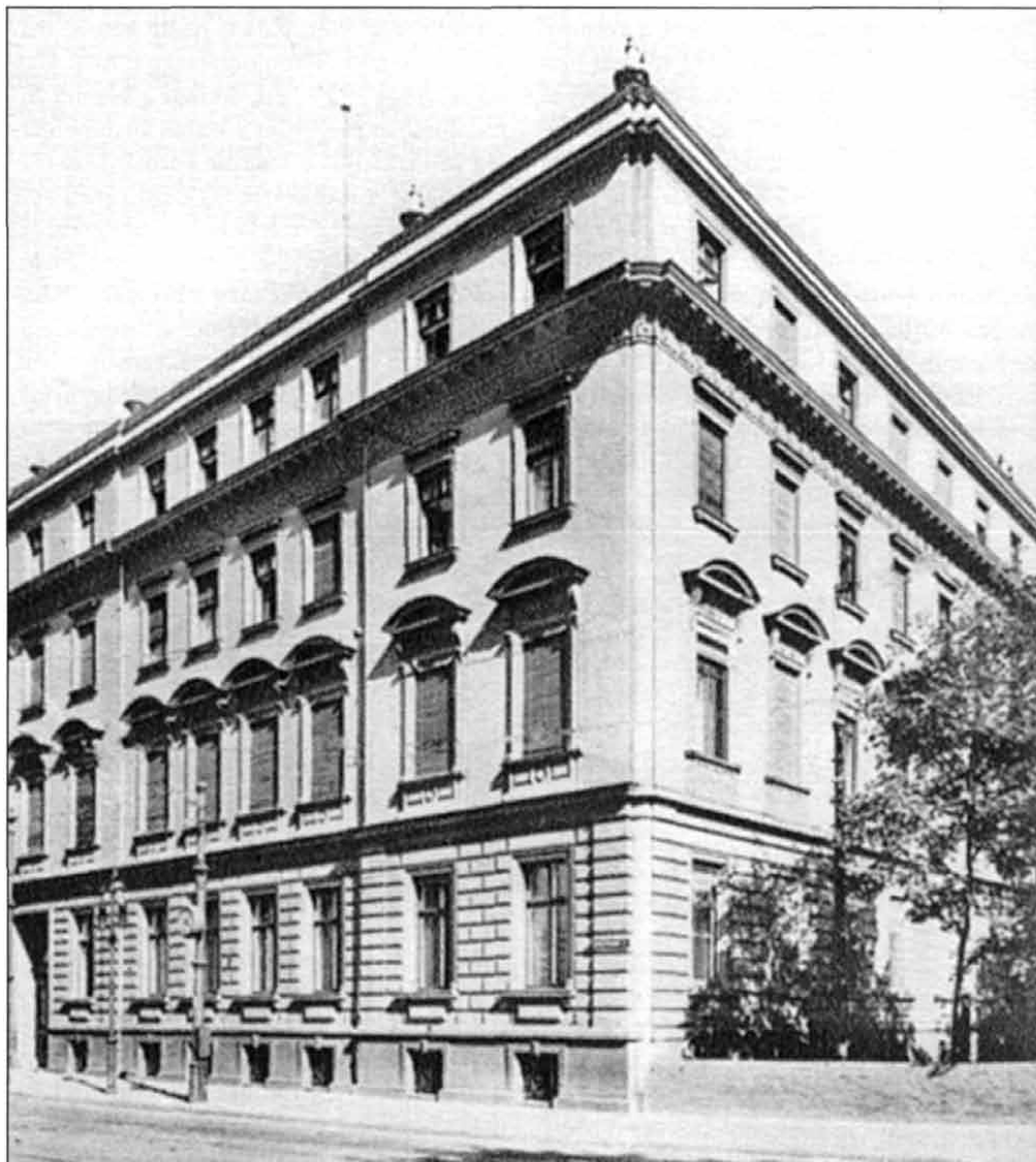
A Collegium Hungaricum az átalakítási munkálatok befejezését követően, 1928 körül (Magyar Művészet, 1929. 7. szám)

a Német Birodalommal szemben a magyar érdekeket védelmező politikát támogatja. A források is ezt a vélekedést támasztják alá. Emiatt lehetett feszült a viszonya a berlini magyar követtel, Sztójay Dömével is, akiről nem lehetett tudni: vajon tényleg Magyarországot képviseli-e Berlinben, avagy inkább a német kívánságok minél teljesebb kielégítésének szószólója Budapesten. A feltétlenül nácibarát, az „idők szavát” visszhangzó Sztójay a „magyar érzelmű” Farkas német állam-