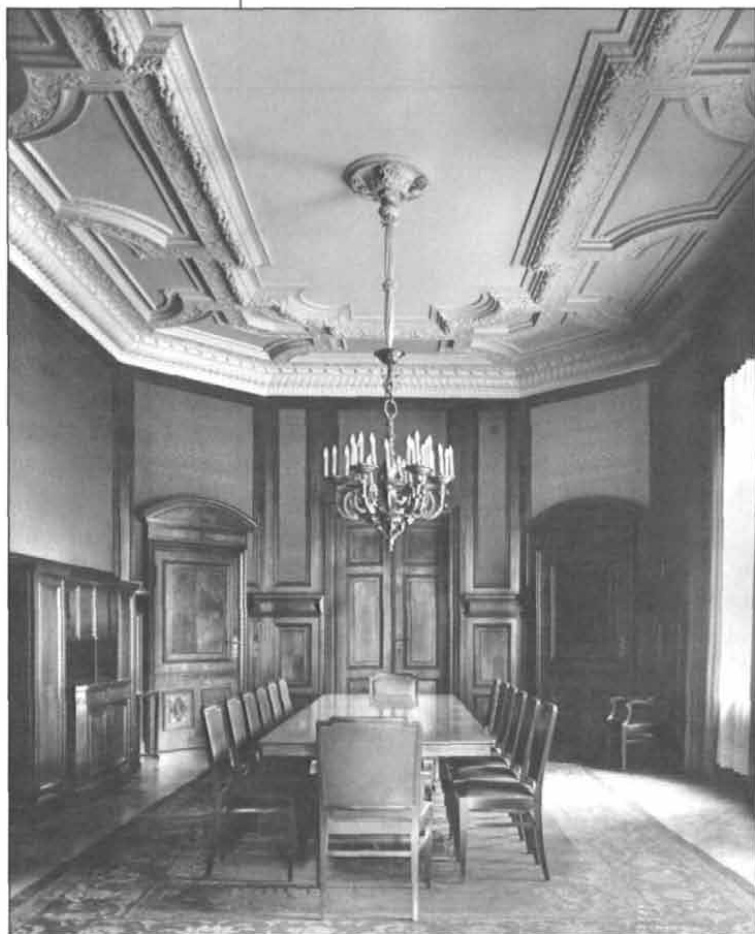
A Collegium Hungaricum ebédlője (Berlini Humboldt Egyetem, Hungarologiai Tanszék)

tózkodó magyar vendégek fogadására is volt lehetőség.