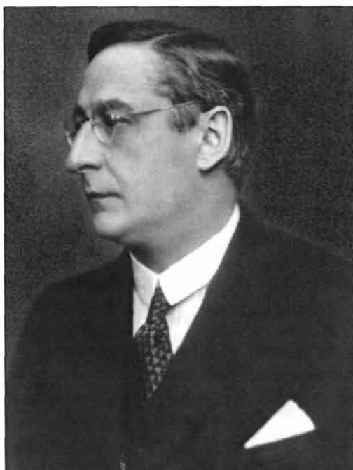
Klebelsberg Kuno gróf (1875–1932), magyar vallás- és közoktatásügyi miniszter (1921–1931), a két világháború közötti magyar kultúrpolitika – részben a klasszikus német tudománypolitikai elvek szerinti – megújítója, 1925 körül (Magyar Nemzeti Múzeum)

Németországnak és Berlinnek a magyar tudomány fejlődésében betöltött rendkívüli szerepe közismert. A protestantizmus magyarországi terjedése következtében az 1520-as évektől a külföldet járó magyar diákok kedvelt célpontjai lettek a német – elsősorban a wittenbergi, a heidelbergi, a göttingeni, a hallei és a jénai – egyetemek. Az 1810-ben ezek mellé csatlakozó Berlin egyeteme már egy új típusú művelődési ideál szellemében született. Az alapító, Wilhelm von Humboldt az oktatás és a kutatás egységét hirdette, a tan szabadság és az egyetemi autonómia elvét vallotta, az állami ellenőrzést a lehető legszűkebb területre kívánta szorítani. Az európai felsőoktatási rendszert mindmáig meghatározó humboldti elképzelések alapján szervezett berlini egyetemre a 19. század folyamán egyre több külföldön tanuló magyar fiatal iratkozott be. A század utolsó negyedében már évente 30 és 50 között ingadozott a számuk. Az egyetem magyar hallgatókra gyakorolt vonzását Berlin birodalmi fővárossá válása (1871) és a nemzetközi tudományos életben betöltött, mindinkább növekvő, majd a századfordulón már vezető szerepe erősítette föl. 1895/96-ban itt kapott az egész további sorsára és szellemiségére ható indítást egy fiatal ember, aki később a két világháború közötti magyar kultúr- és tudománypolitika meghatározó személyisége s a berlini