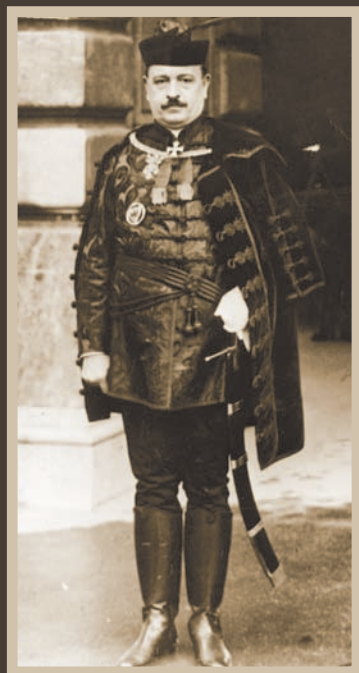
Hóman Bálint díszmagyarban

Kodolányi János Főiskola Történeti Műhelyének kiadványai, 1.