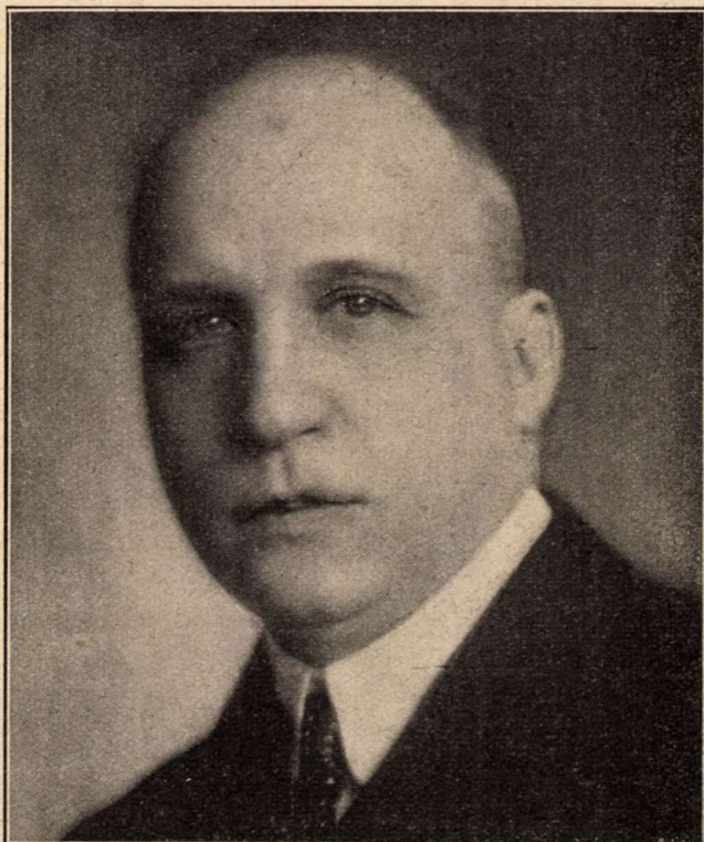
Walkó Lajos, külügyminiszter.

Az önálló Magyarország önálló külügyi politikája