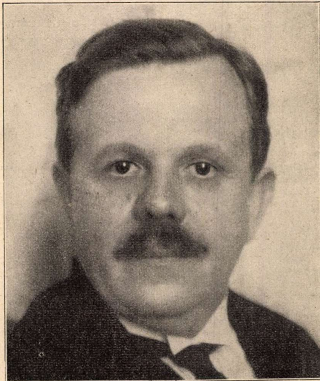
Bud János dr. pénzügyminiszter.

27 állammal kötöttünk eddig legnagyobb kedvezményű vagy tarifális szerződést. — Bud János írta meg az első magyar árstatisztikát. — A gyermek-munkásokról és a válásról is írt tanulmányt a pénzügyminiszter, aki éveken át lapszerkesztő is volt. — Több mint 21 millió pengő a pénzügyminisztérium üzemeinek a feleslege.