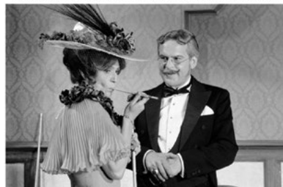
Psota Irén és Latinovits Zoltán 1971

© Rendező Visegrádi Négyek Építészeti Alapítvány website: www.v4fund.archi , https://klebelsbergkastely.hu/esemenyek/