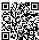
Újváry Gábor jelen és jövő