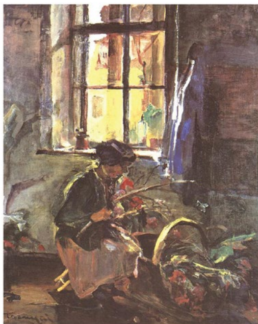
Tornyai János: Virágháló 1933

Többségük az Alföldön született, ahonnan indulva bejárták Európát, és kiválóan képzett művészekké lettek. S azzal a világban látott tudásukkal visszajöttek, de nem Budapestre, hanem az Alföldre. Úgy érezték, oda kell hazatérniük, hogy a festészetükkel ott tanítsanak, azt a vidéket műveljék. Ezzel a hatalmas ambícióval a hátizsákjukban telepedtek le az Alföldön, de művészetüket látva, azt is ki kell mondani, hogy nehéz próbának, magas elvárásnak tették ki magukat. A Hódmezővásárhelyen letelepedő Tornyai szinte belerokkant a feladatba. Az Alföldről százával festette kisméretű képeit, amelyek olyanok, mint egy-egy rövid naplójegyzet, ám nem lett belőlük regény, de még novella sem – fogalmazott az előadó. Az Alföldhöz kötődő képeiből nem születtek összegző főművek.