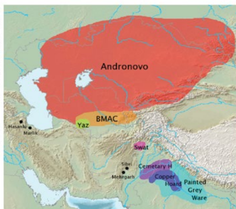
A feltételezeten indáraind andronovói kultúra és tőle délre indáraind a feltételezeten indáraind továbbindáraind eredményezte kultúrák.

A rendezvények támogatója az Emberi Erőforrások Minisztériuma