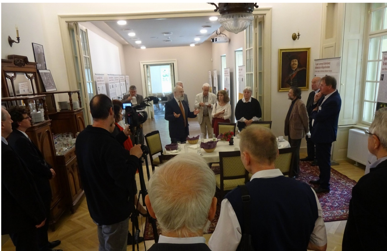
Klebelsberg, a sportminiszter, c. SPORTTÖRTÉNETI KONFERENCIA * Klebelsberg-kastély Emlékház Pesthidegkút 2019. május 31. Rendező a V4 Építészeti Alapítvány http://v4fund.archi/ v4@v4fund.archi