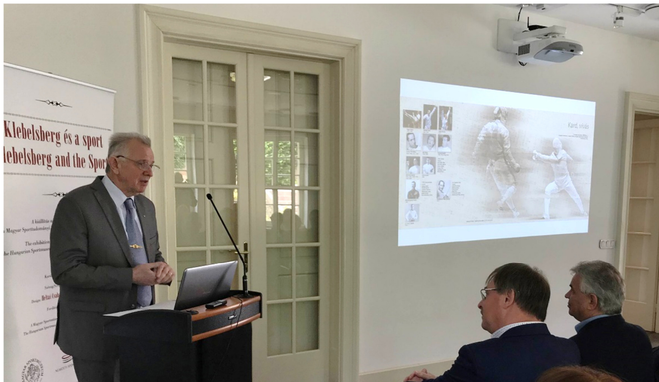
Schmitt Pál a Nemzet Sportolója, kétszeres olimpiai bajnok párbajtőrívívó, sportdiplomata és diplomata, a Nemzetközi Olimpiai Bizottság tagja, közgazdász politikus, Magyarország volt köztársasági elnöke

A konferencia egyik nagy kérdése az volt, hogy ez a múlt vajon befolyásolja-e napjaink sportéletét, mutathat-e példát a 21. században, illetve vonható-e párhuzam a csaknem száz éve történtek és a jelen sporttal kapcsolatos eseményei között.