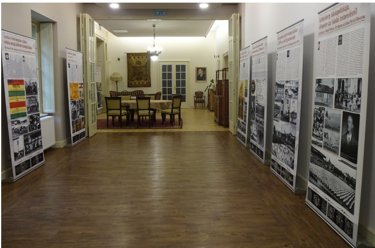
Klebelsberg a sportminiszter c. kiállítás